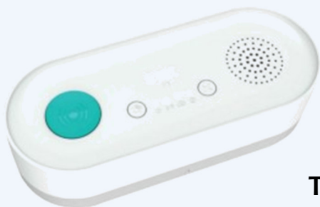
TELECOMANDO DELLA CENTRALINA